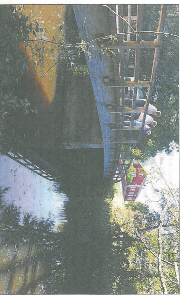
Sirppujoki-hankkeen toteuttajat tutkivat Sirppujokea.

OJENNA KÄTESI. Muista virallinen henkilötodistus. Luovuttajainfo 0800 0 5801 • vertipalvelu.fi • sovinkeiluovuttajaksi.fi