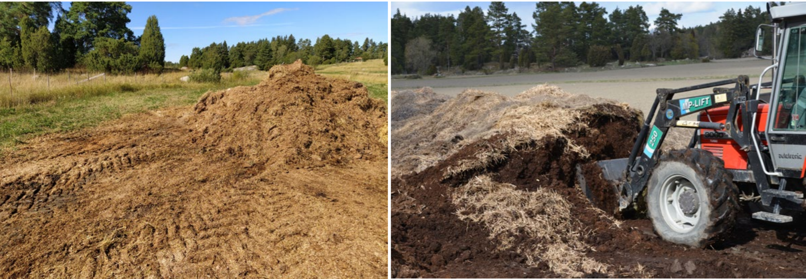
Kuivalanta varastoidaan usein aumassa lähellä levityspaikkaa. Alle kuukauden mittaisesta varastoinnista ei tarvitse tehdä aumaailmoitusta kuntaan.