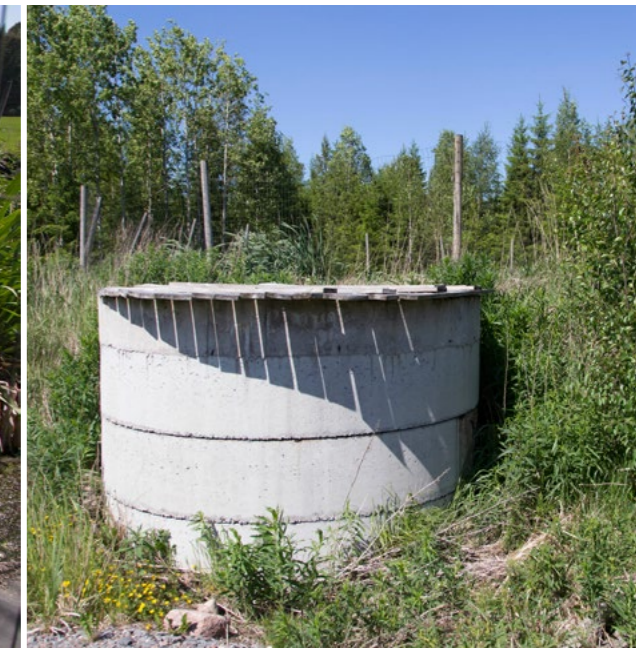
Lietelaguuni on edullinen lietalannan varastoratkaisu. Lietelanta voidaan erillisen kaivon kautta kuormata ilman allaskumin rikkoutumisvaaraa.